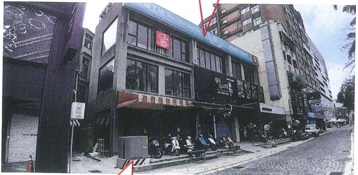
台電設置變壓器及相關供電設備位置