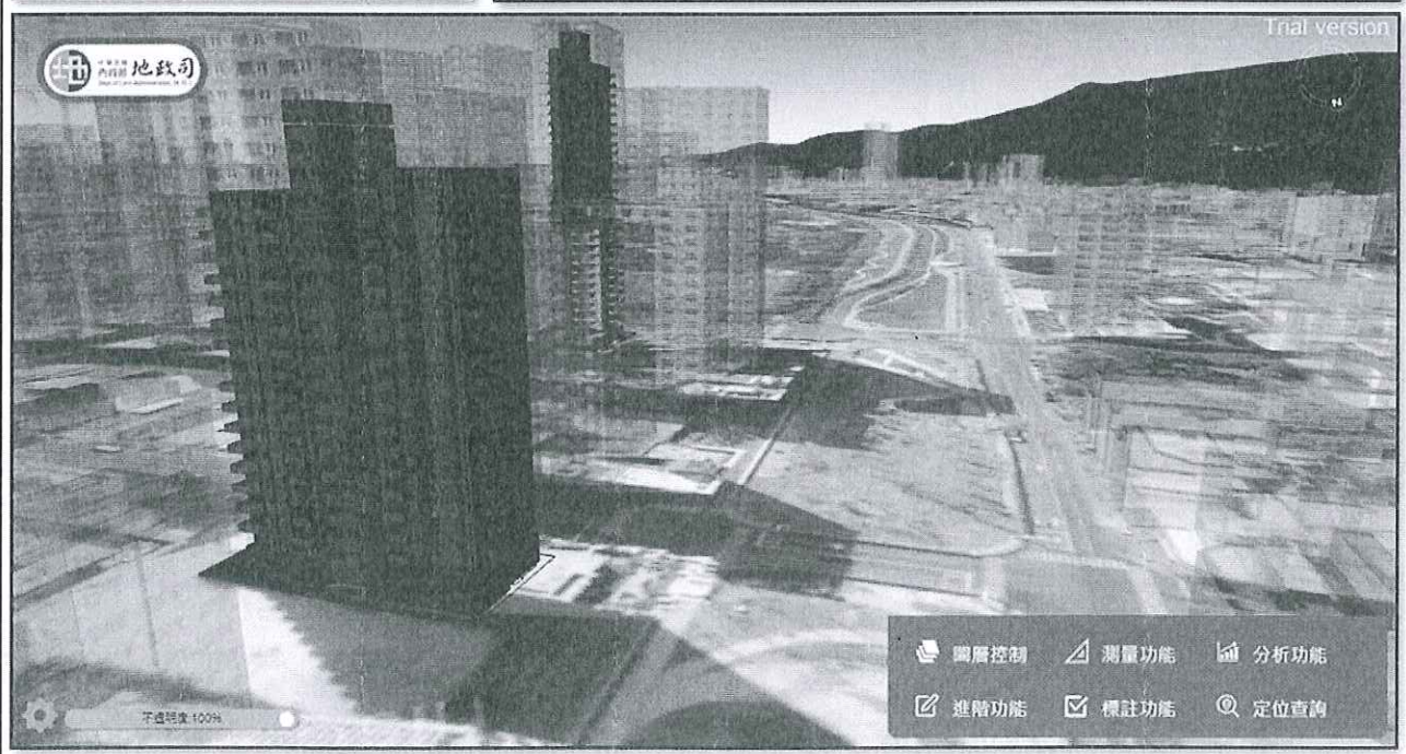
【圖資整合展示情形】