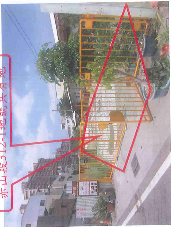
赤山段312-1地號共有地