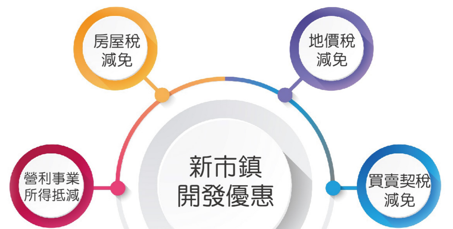
新市鎮開發條例第14條