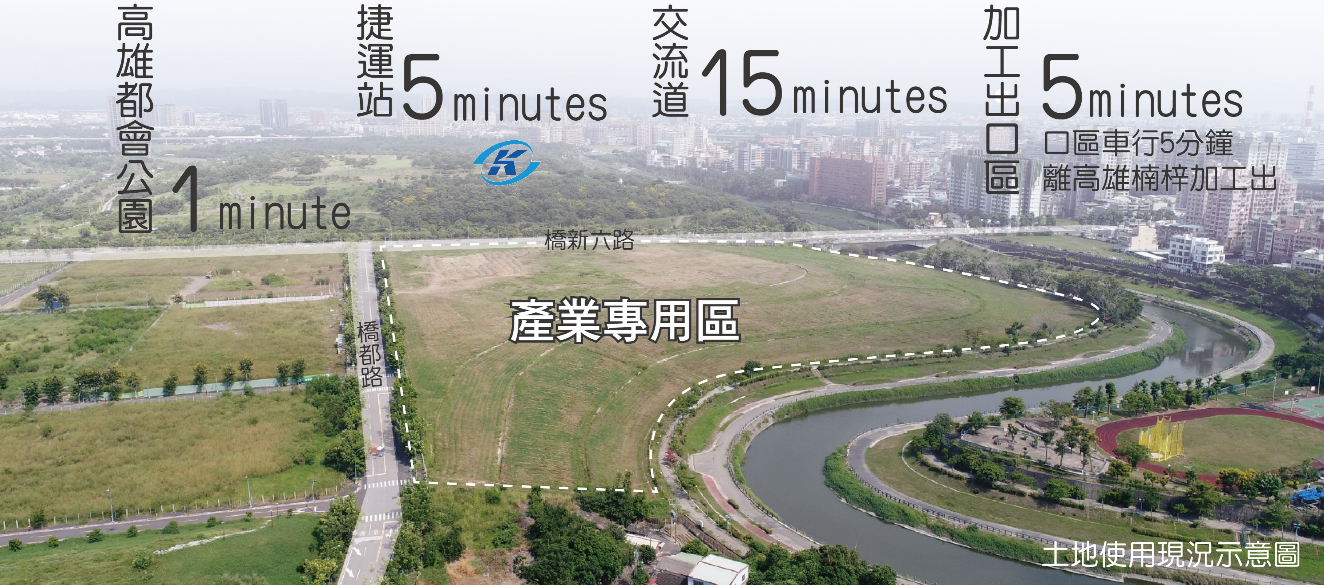
土地使用現況示意圖