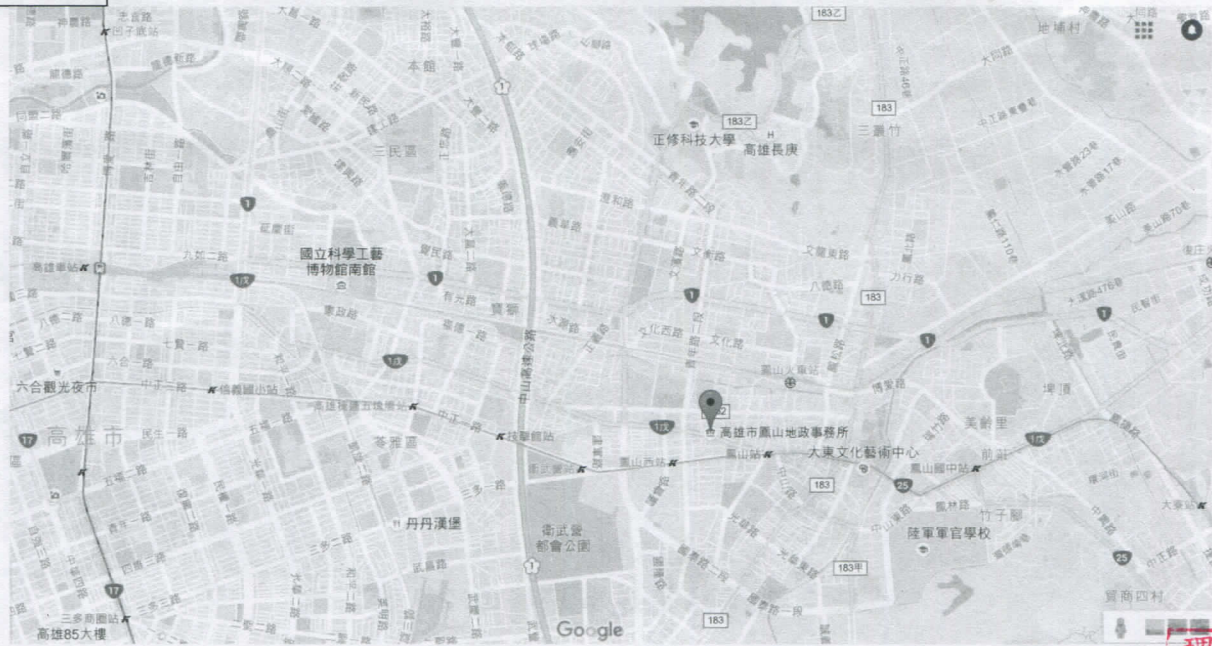
地址：高雄市鳳山區中山西路 154 之 6 號