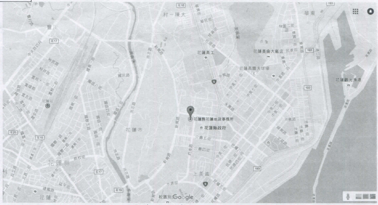
地址：花蓮縣花蓮市府後路23號3樓