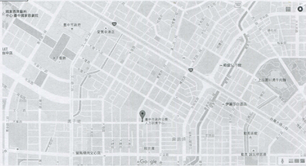
地址：臺中市西區東興路三段 246 號 8 樓